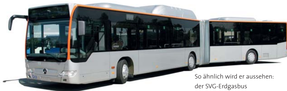
So ähnlich wird er aussehen: der SVG-Erdgasbus

Erdgasfahren ist umweltschonend und energieeffizient. Das gilt nicht nur für PKW.